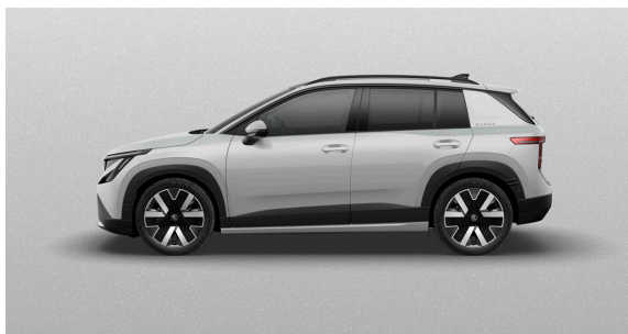
Metallic Platinum Weiss