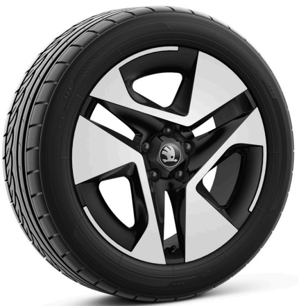
Jantes en alliage léger 7,0 J x 18" «Saola», noir brillant