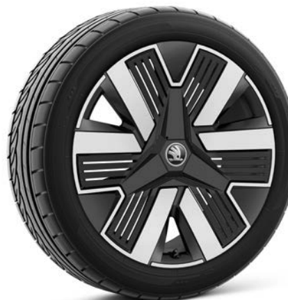
Jantes en alliage léger 8,0 J x 19" «Lark», noir brillant avec panneau Aero noir