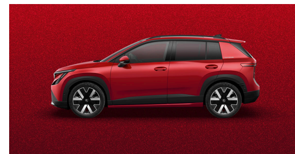
Métallisée spéciale Rouge Jasper

Les prix s'entendent en CHF et incluent 8.1% TVA. Certains des équipements optionnels mentionnés ci-dessus ne peuvent être commandés qu'en association avec d'autres équipements supplémentaires. Les couleurs représentées peuvent différer des couleurs effectives de la peinture en fonction de sa qualité. De plus, lesdits équipements optionnels ne peuvent pas tous être combinés entre eux. Veuillez contacter votre partenaire Škoda pour de plus amples informations.