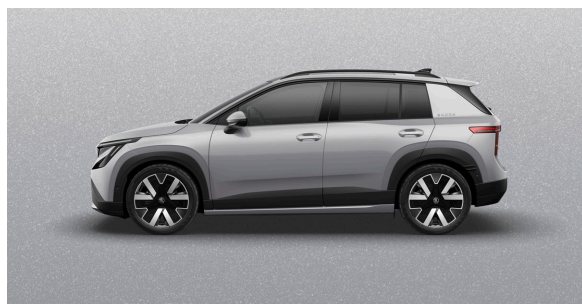
Metallizzato Argento Pebble