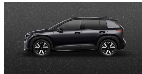
Metallizzato Nero Mystery