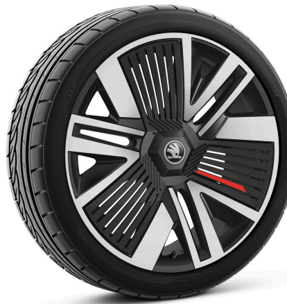
Cerchi in lega leggera 8,0 J x 20" «Macaw», nero lucido con pannello Aero nero

I prezzi si intendono in franchi svizzeri incl. IVA dell'8.1%. Alcuni degli equipaggiamenti supplementari riportati in alto possono essere ordinati solo in abbinamento con altri equipaggiamento supplementari. Inoltre, non tutti gli equipaggiamenti supplementari elencati sono combinabili tra loro. Per informazioni particolareggiate la preghiamo di rivolgersi al suo partner Škoda.