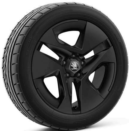
Cerchi in lega leggera 7,0 J x 18" «Plover», nero