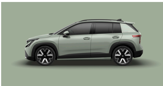
Unita Verde Timiano