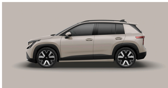
Unita Grigio Marble